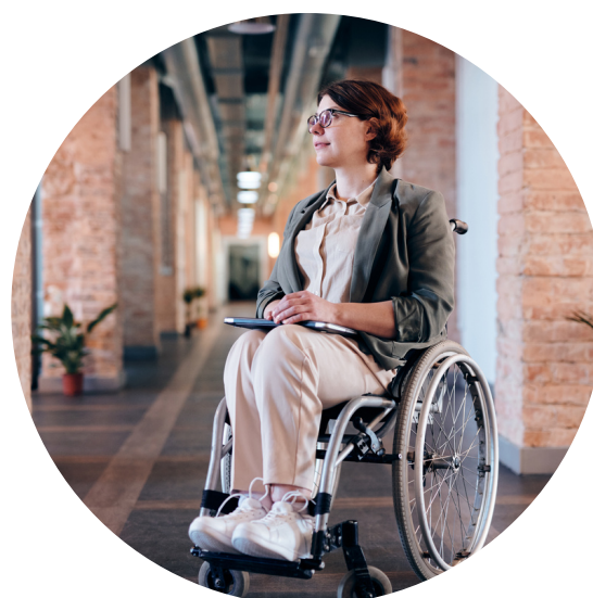
Nodarbinātie ar īpašām vajadzībām