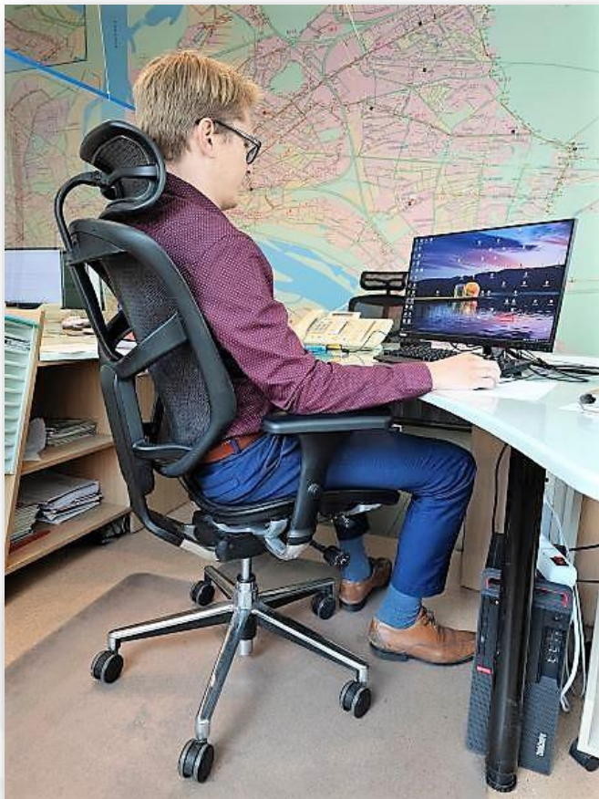
Pašu darbinieku izvēlēti ergonomiski krēsli