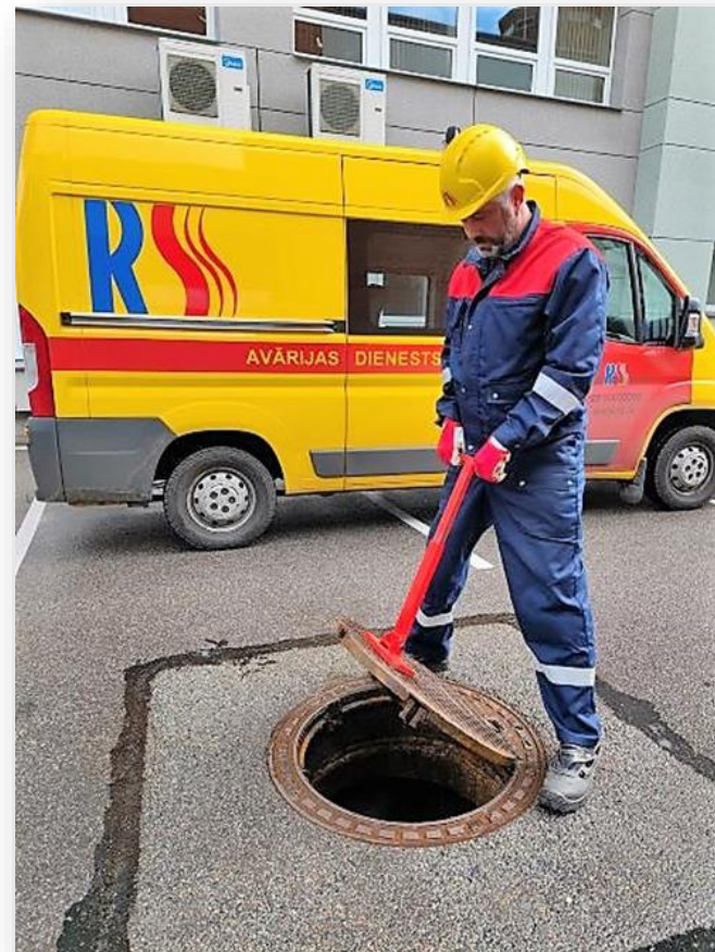
Magnētiskie aku vāku pacelāji