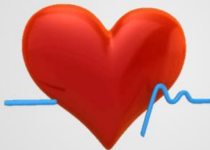
Automatizēta asinsspiediena mēriekārta