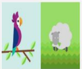
320_2106_Videopado...mov 70 MB