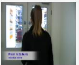
316_Macekla_stasts...mp4 571 MB