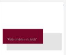
314_2016_Riciba_ar...mp4 696 MB