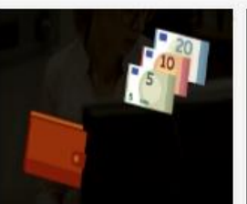
006_278_2015_Darba...mp4 497 MB