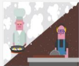
321_2016_Videopado...mov 70 MB