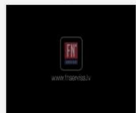
309_2016_Riski_pav...mp4 1.5 GB