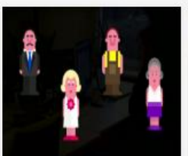
007_279_2015_Runa...mp4 455 MB