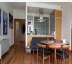
318_2016_Pedejije_v...mp4 391 MB