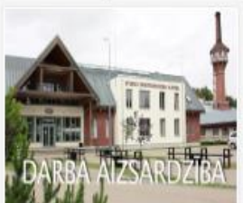
308_2016_DA_veseli...mp4 1.4 GB