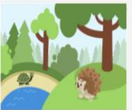
319_2016_Videopado...mov 59 MB