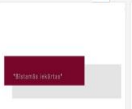
315_2016_Bistamas...mp4 701 MB