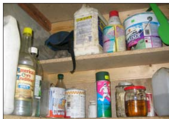
6. attēls. Ķīmisko vielu glabāšana neatbilstošos un nemarkētos traukos – nelaimes gadījumi var notikt, netišām tās iedzerot vai nepareizi lietojot.