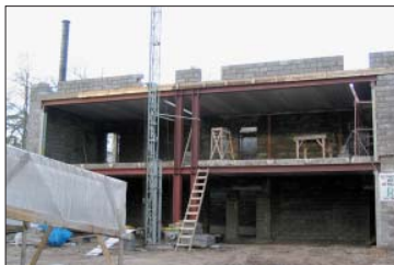
3. attēls. Drošai kāpšanai nepiemērotas kāpnes un nenozogotas atvērumu malas – nelaimes gadījumi var notikt, kāpjot augšā vai lejā, jo kāpnes nav pietiekama garuma.

Šī materiāla uzdevums ir iepazīstināt ar jauno nelaimes gadījumu izmeklēšanas un uzskaites kārtību.