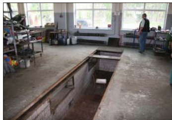
4. attēls. Nenosegta remonta bedre autoservisā – nelaimes gadījumi var notikt, netišām iekrītot bedrē vai kāpjot tai pāri.