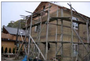
5. attēls. Prasībām neatbilstošas sastatnes – nelaimes gadījumi var notikt, krītot no sastatnēm vai tām sabrūkot.