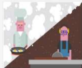
321_2016_Videopado...mov 70 MB