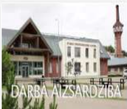
308_2016_DA_veseli...mp4 1.4 GB