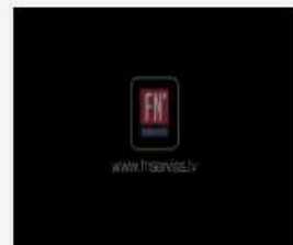
309_2016_Riski_pav...mp4 1.5 GB