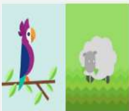
320_2106_Videopado...mov 70 MB