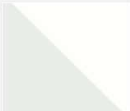
009_282_2015_Darba...mp4 83 MB