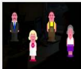
007_279_2015_Runa...mp4 455 MB