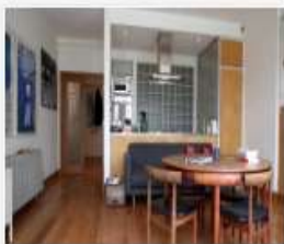
318_2016_Pedejeje_v...mp4 391 MB