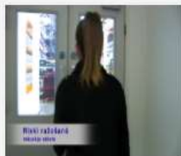
316_Macekla_stasts...mp4 571 MB