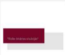
314_2016_Riciba_ar...mp4 696 MB