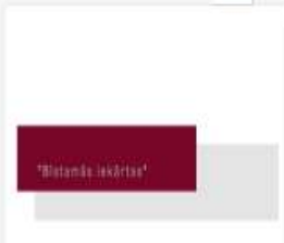
315_2016_Bistamas...mp4 701 MB