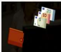
006_278_2015_Darba...mp4 497 MB